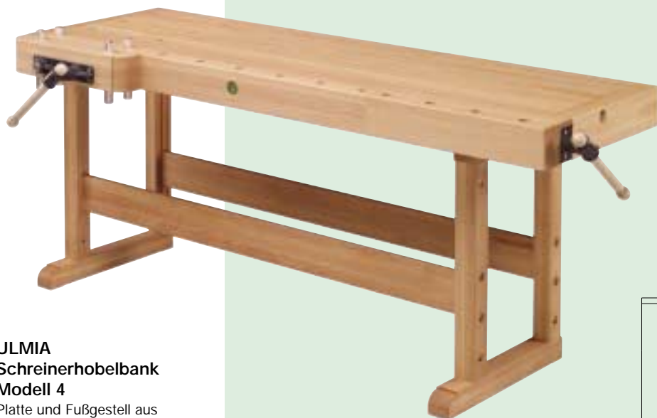
Schreinerhobelbank Modell 4