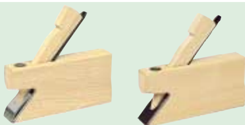
Modell HW 8A