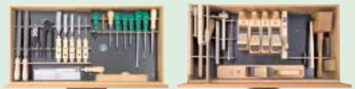
Das Werkzeugsortiment 304 – 37-teilig im Unterbausschrank 10-20